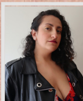
Manuela Uribe Producción