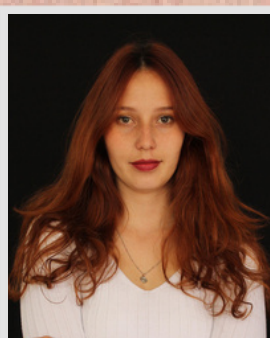
Miranda Zapata Actriz