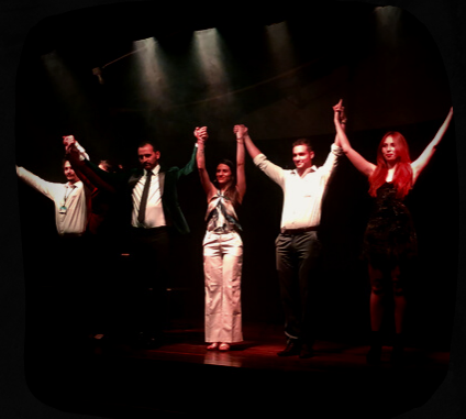
En el XVIII Festival de las Artes de Usaquén en la Casa Cultural Babilonia

Seleccione la sospechosa que considere culpable.