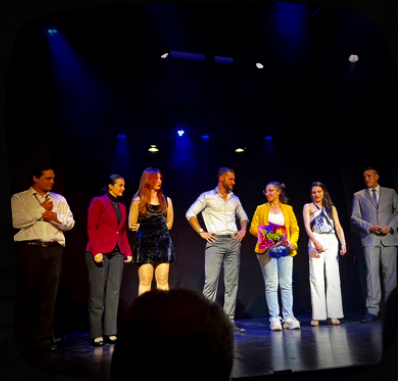
En nuestra función de estreno en el Teatro Bernardo Romero Lozano.

Con esta obra buscamos reivindicar a la mujer colombiana a través de una revisión crítica de las etiquetas de "Esposa", "Amante" y "Puta", calificativos ligados a prejuicios sociales a los que los espectadores se enfrentan para escoger el final de la obra y, con él, el destino de los personajes.